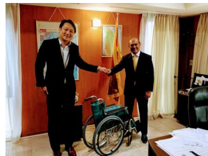
藤間理事長と大使とでグータッチ