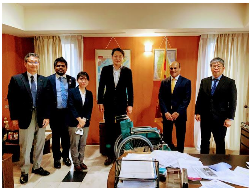
中央：藤間理事長 その右：特命全権大使

開設当初より使用してきた車いすの一部をリニューアルするため、令和3年4月に10台の車いすを入れ替えました。オープンより使用してきた車いすをただ捨てるのではなく、何か再利用できないか考えた結果、たまたまスリランカ大使館の目にとまり、寄贈することになりました。